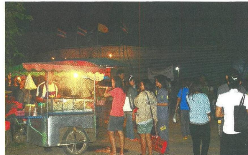
รถเร่-ของชาย อีกหนึ่งองค์ประกอบของการเสพหนึ่งกลางแปลง