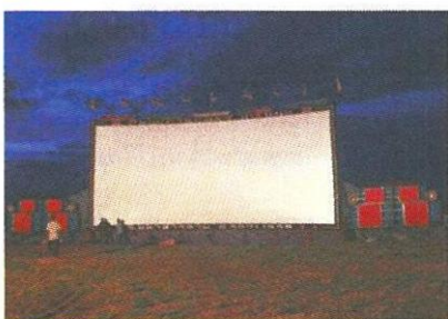
ระหว่างเตรียมฉายหลังกลางแปลง

ด้วยความชอบส่วนตัวที่ได้ชมหนังกกลางแปลงบ่อยครั้ง เอกพงษ์บอกว่า ปัญหาในการฉายหนังกกลางแปลงก็มีบ้าง เช่นเรื่อง