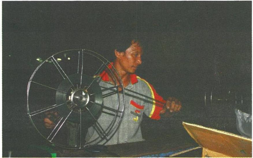
คนฉายหนึ่งต้องเรียนรู้ครบวงจรในธุรกิจหนึ่งกลางแปลง

จะได้จำนวนมาก แต่ปัจจุบันลดน้อยลงเนื่องจากความเปลี่ยนแปลงตามยุคสมัยก็ยังคงเป็นตัวแปรสำคัญ ทั้งนี้ยังขึ้นอยู่กับฤดูกาลและเทศกาลด้วย ถ้าเป็นช่วงออกพรรษาลอยกระทง ปีใหม่ สงกรานต์และงานทำบุญต่างๆ ที่ต้องจ้างมหรสพไปแสดงก็จะมียานจำนวนมาก แต่ถ้าช่วงเข้าพรรษาจะไม่ค่อยมีงานถึงมีก็มีน้อยถ้าไม่เป็งานต่วนงานแก้บน และ