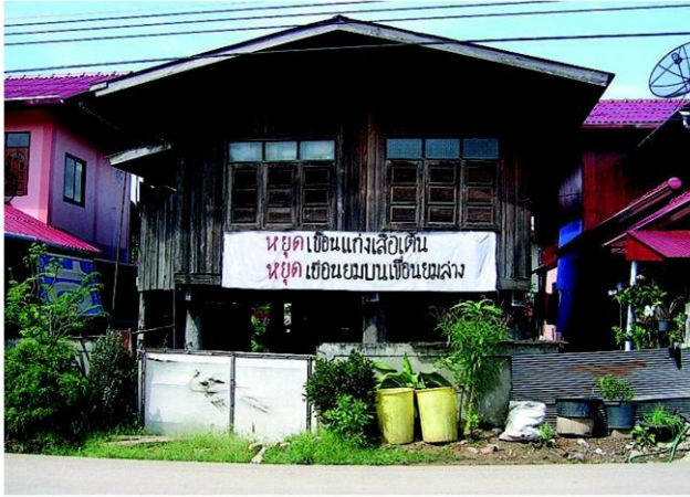
ขึ้นป้ายคัดค้านทั่วหมู่บ้าน

ต่อมาปีพ.ศ.2534 เกิดภัยแล้ง ก็ให้เหตุผลว่าป้องกันภัยแล้ง ครั้นปีพ.ศ.2538 เกิดน้ำท่วมใหญ่ก็บอกว่าเป็นป้องกันน้ำท่วม มาถึงปัจจุบันเกิดอุทกภัยขึ้นในภาคกลาง ก็อ้างอีกเพื่อป้องกันน้ำท่วม