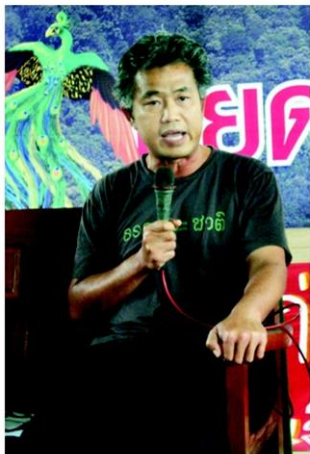
นิคม พุทธา

แต่เป็นเพราะพื้นที่ป่าต้นน้ำของกลุ่มน้ำยม โดยเฉพาะกลุ่มน้ำยมตอนบน ตั้งแต่ อ.เขียงม่วน อ.ปง จ.พะเยา อุทยานแห่งชาติดอยภูนาง