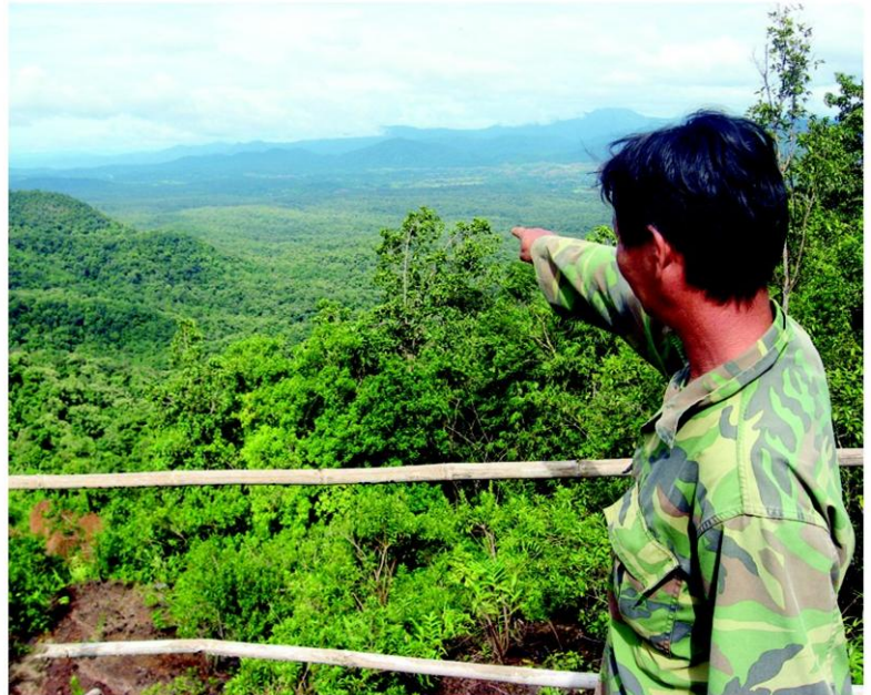
ผืนป่าสักทองจะถูกทำลายหากมีเขื่อน

นอกจากนี้ ยังมีเวทีเสวนาแลกเปลี่ยนถึงปัญหาของเขื่อนแก่งเสือเต้น และเขื่อนต่างๆ ในประเทศไทย ในหัวข้อ “เขื่อนกับการแก้ไขปัญหาน้ำท่วม และงบฯ 3.5 แสนล้าน ประชาชนได้อะไรและจะเสียอะไร”