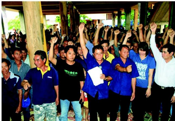
ชาวสะเอียบประกาศเจตนารมณ์

ในส่วนของชาวบ้านเอง นอกจากยื่นกรณไม่เอาเขื่อนแก่งเสือเต้นแล้ว ตลอดระยะเวลากว่า 20 ปี ที่คัดค้าน ก็ยังมีส่วนร่วมอนุรักษ์ผืนป่า