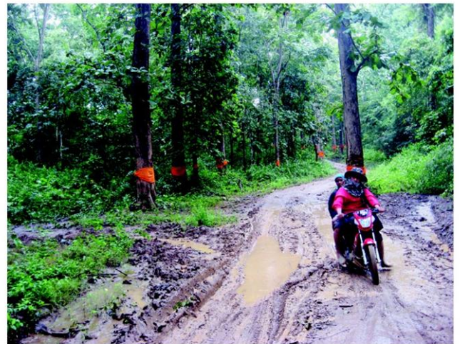
ชาวบ้านหาของป่าเล็กๆ น้อยๆ เพื่อยังชีพ

นายประสิทธิ์พร กาพ่อนศรี ผู้ประสานงานเครือข่ายลุ่มน้ำยมระบุว่าพื้นที่ ต.สะเอียบ มีป่าสักทองที่สมบูรณ์หนาแน่น มีขนาดลำต้นใหญ่กว่า 1 เมตร กว่า 24,000 ไร่ มีมูลค่าสูงถึง 10,000 ล้านบาท ป่าเบญจพรรณ 36,000 ไร่ ที่พืชผักสมุนไพรอีกเป็นจำนวนมาก