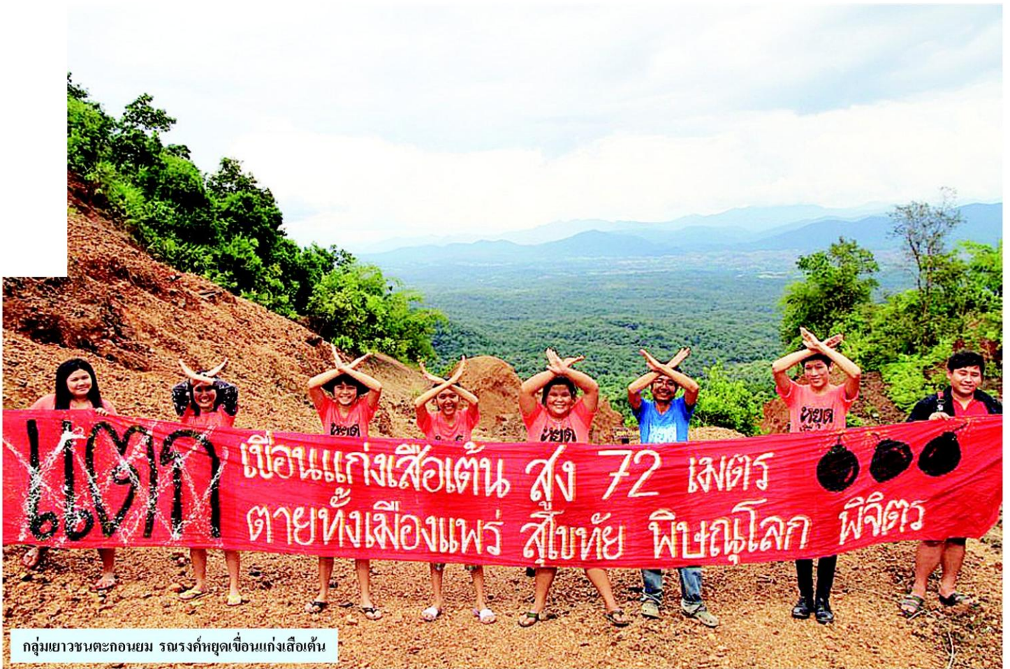
กลุ่มเยาวชนตะกอนยม รณรงค์หยุดเขื่อนแก่งเสือเต้น