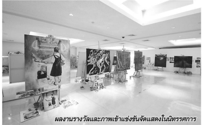
ผลงานรางวัลและภาพเข้าแข่งขันจัดแสดงในนิทรรศการ

“งานศิลปะที่ดี ดูแล้วได้อารมณ์กระทบใจทันที เกิดความรู้สึกอยากติดตามเข้าสู่กระบวนการคิดของศิลปิน และดูว่ามีลูกเล่นอะไรบ้างให้ตื่นเต้นเร้าใจ ศิลปะที่ดีต้องมีความพอดีและมีเอกภาพ คนที่ควรรางวัลคือคนที่เก่งที่สุด ส่วนคนที่พลาดรางวัลอย่าท้อถอย ให้พัฒนาตัวเอง