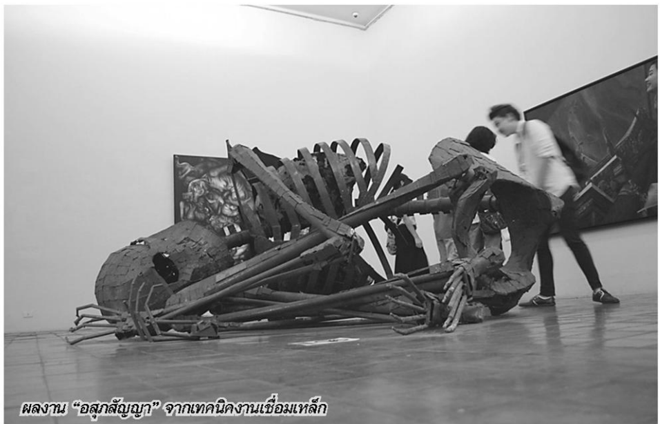
ผลงาน "อสุกสัญญา" จากเทคนิคงานเชื่อมเหล็ก

ที่กล่าวมาเป็นเพียงบางส่วนของนิทรรศการ เท่านั้น ยังมีผลงานที่ถูกสร้างสรรค์โดยเยาวชน ฝีมือเยี่ยมมากมาย รอให้ผู้ชมเข้ามาสัมผัสแนวคิด คนรุ่นใหม่ผ่านงานศิลป์ทั้ง 6 สาขา ตั้งแต่วันที่ ถึง 28 กุมภาพันธ์ 2556 ณ ห้องนิทรรศการ 5-8 พิพิธภัณฑ์สถานแห่งชาติ หอศิลป์ ถนนเจ้าฟ้า