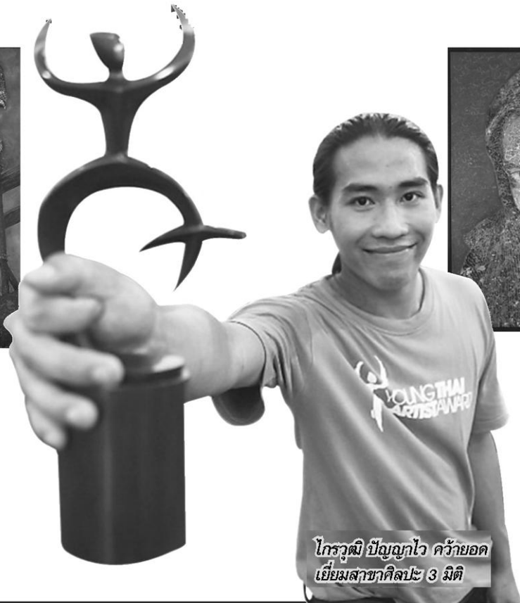
กรวูดี ปัญญาไว คิวภัยอด เยี่ยมสาขาศิลปะ 3 มิติ

ห ลังจากมีการประกาศผล Young Thai Artist Award 2012 ทั้ง 6 สาขา ได้แก่ สาขาศิลปะ 2 มิติ, สาขาศิลปะ 3 มิติ, สาขาภาพถ่าย, สาขาภาพยนตร์, สาขาวรรณกรรม และสาขาประพันธ์ดนตรี ไปเป็นที่เรียบร้อยแล้ว ทางมูลนิธิเอสซีจี ผู้สนับสนุนโครงการ และเหล่าคณะกรรมการผู้ทรงคุณวุฒิ ได้ร่วมกันเปิดนิทรรศการรางวัลศิลปะเพื่อเยาวชนไทย จัดแสดง