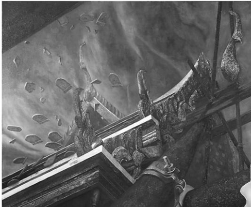
“ความเปลี่ยนแปลงของสถาปัตยกรรมไทย”