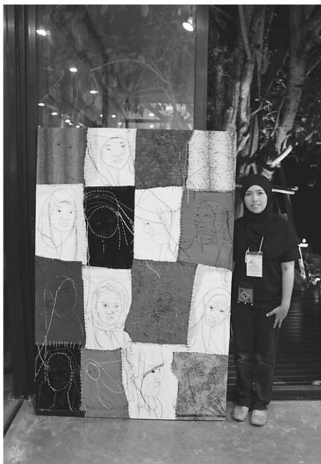
ใบหน้าของหญิงสาวที่เต็มไปด้วยความสูญเสียของซัลวานี ทะยี่สะแม

นี่เป็นการเปรียบเทียบมุมมองความคิดของคนกับสัตว์ที่มีต่อไหมพรม โดยคนทั่วไปอาจมองว่าไหมพรมเป็นสัญลักษณ์ของความยุ่งเหยิงและปมปัญหา ทำให้ไหมพรมกลายเป็นสัญลักษณ์ของ