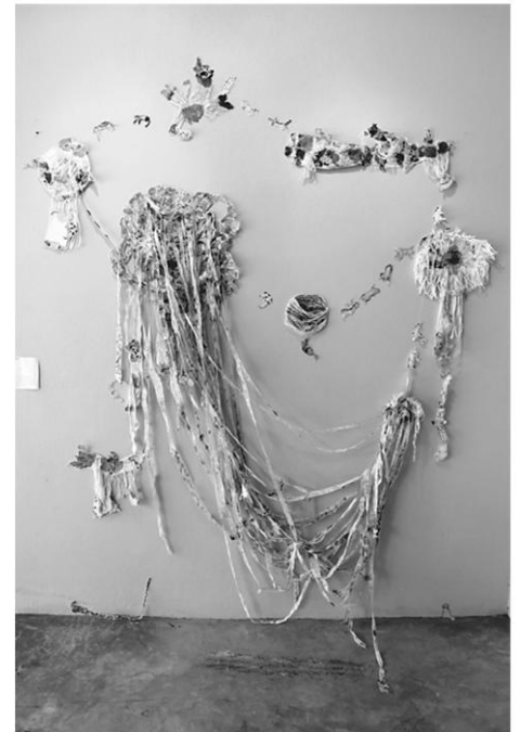
การเล่นไหมพรมที่ดูยุ่งเหยิงของเจ้าเหมียว โดยเพียงขวัญ คำหรุ่น

นอกจากนี้ ทางคณะกรรมการฯ ยังได้เพิ่มรางวัลพิเศษ คัดเลือกนักศึกษาเดินทางไปดูงานนิทรรศการ Documenta ณ เมือง Kassel ประเทศเยอรมนี อีก 2 รางวัล โดยผู้ได้รับการคัด