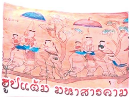
อุปแต้ม มหาวสารคาม

ให้กับชาวบ้าน ในขณะที่เดียวกันนิสิตของเรา ก็ได้ร่วมเรียนรู้เพราะต่อไปนิสิตวิทยาลัยการเมืองฯ จะได้ออกมาเป็นนักพัฒนาผู้นำชุมชน ...สำหรับกิจกรรมอีกแห่งหนึ่งคืออุปแต้มดงบัง ยังมีชุมชนที่รกรากแสดงวิถีชีวิตของชุมชน ภาพวาดบนกระดากโปสเตอร์หมอน-กรอบรูปอุปแต้มและการแข่งขันการวาดภาพของเด็กเยาวชน เพื่อให้เรียนรู้วิถีการวาดภาพ สร้างกระบวนการคิด และเรียนรู้งานศิลปะ ซึ่งจะเป็นพลังสำคัญในการขับเคลื่อนสังคมให้เกิดการอนุรักษ์ทิวทัศน์วัฒนธรรมของตนอย่างยั่งยืน