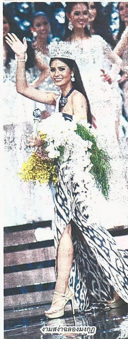
งามสง่าฉลอมงกุฏ