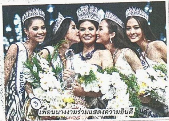
เพื่อนนางงามรวมแสดงความยินดี