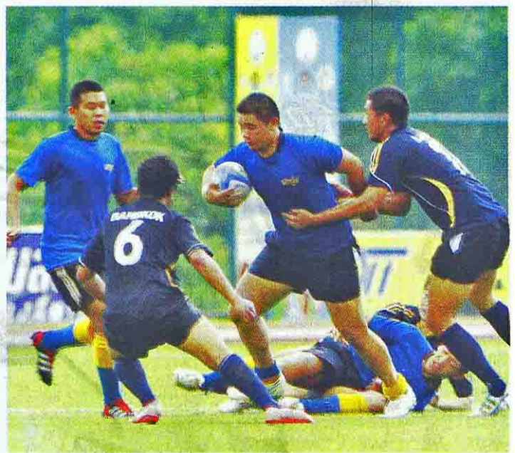
กีฬาชนิดต่างๆ ที่จะเป็นที่ประลองฝีมือของเยาวชนไทยในครั้งต่อไปที่ จ.มหาสารคาม

ปิดฉากลงไปหมาดๆ เมื่อวันที่ 5 มิ.ย. ที่ผ่านมา สำหรับการแข่งขันกีฬาเยาวชนแห่งชาติ ครั้งที่ 28 หรือในชื่อ "ภูเกิดเกมส์" ที่จังหวัดภูเก็ต แม้จะมีอุปสรรคในการชิงชัยบางชนิด กีฬากลางแจ้ง ด้วยเพราะเจอฝนกระหน่ำอยู่