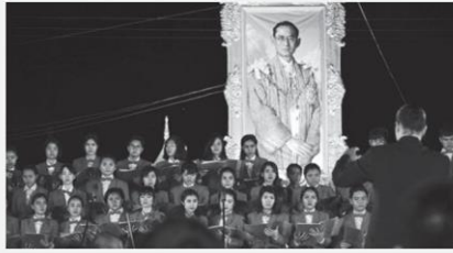
ร้อยชีวิตนิสิตมหาสารคาม ขับขานเพลง 'อาลัยพระพ่อภูมิพล' >13