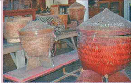
'กองข้าวใหญ่' ที่ชาวอีสานอุทิศแด่ญาติผู้ล่วงลับ เนื่องในงานบุญมหากรรม

ไม่เพียงอาคารจัดแสดงเท่านั้น แต่ตอนปลูก หนองน้ำสาธารณะ โบราณสถานต่างๆ เช่น ปราสาทกุ๊กกาสิงห์