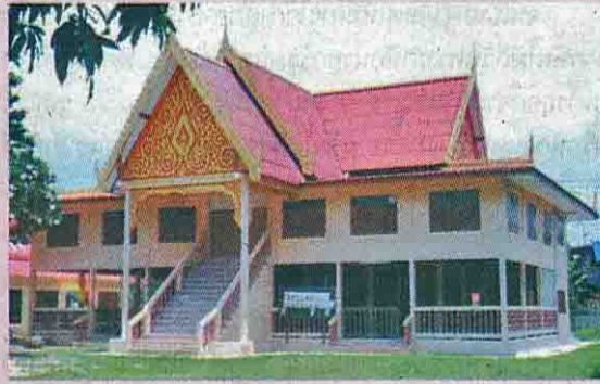
ศาลาการเปรียญเดิมของวัดสว่างอารมณ์ซึ่งชาวบ้านร่วมกันปรับปรุงแล้วก่อตั้งพิพิธภัณฑ์ ขึ้นเมื่อ พ.ศ. 2548