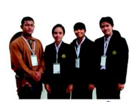
"อาชาช่วยน้องสมาธิสั้น" มหาวิทยาลัยแม่โจ้ วิทยาเขตแพร่-เฉลิมพระเกียรติ