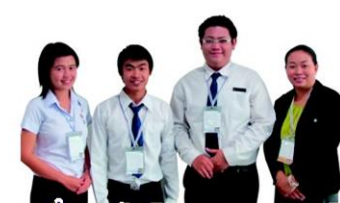
"เครื่องแกงบ้านสันมะนะ สะอาด ปลอดภัย และอร่อยถือเรื่องไม่แพ้ใคร" วิทยาลัยเชียงราย