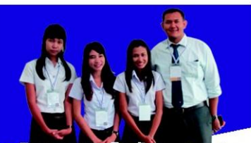
"การพัฒนาชุมชนบวรใหม่ด้วยการบริหารจัดการ สหราชอาณาจักรอย่างยั่งยืนในอ่าวปัตตานี" มหาวิทยาลัยสงขลานครินทร์ วิทยาเขตปัตตานี