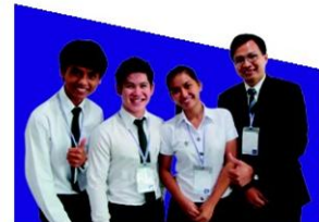
"สัตว์บาล-เคอูนาคามารู สู่วิกฤตอุทกภัย" มหาวิทยาลัยเกษตรศาสตร์