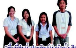
"พื้นที่ชุ่มน้ำประดิษฐ์บำบัดน้ำเสีย สืบสานพระราชดำริเพื่อชุมชน" มหาวิทยาลัยมหาสารคาม