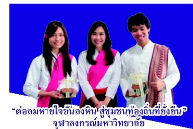
"ต่อลมหายใจชั้นหลังหิน" ชุมชนท้องถิ่นที่ยั่งยืน จุฬาลงกรณ์มหาวิทยาลัย