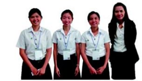
"มหัศจรรย์สี่สีสั้นขี้ควาย" มหาวิทยาลัยเกษตรศาสตร์ วิทยาเขตสกลนคร