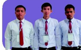
"โรงอบยางพาราด้วยพลังงานแสง อาทิตย์เพื่อพัฒนาคุณภาพชีวิต ของชาวสวนยาง" มหาวิทยาลัยราชภัฏเลย