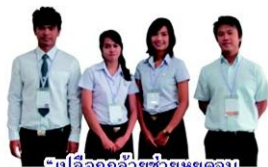
"เปลี่ยนกล้วยช่วยหยุดจน ชุมชนมีรอยยิ้ม" มหาวิทยาลัยนครสวรรค์