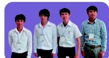
"เครื่องเตือนภัยน้ำหลาก" มหาวิทยาลัยราชภัฏเชียงราย