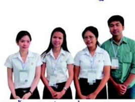
"หัวเชื้อราอดเม็ด" เพื่อการพัฒนาชุมชน โลกขาม จ.สมุทรสาคร ตามปรัชญา เศรษฐกิจพอเพียง มหาวิทยาลัยเทคโนโลยีราชมงคลธัญบุรี