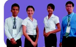
"ศูนย์กลางการเรียนรู้ธุรกิจชุมชน เพาะเห็ดฟาง เขตพื้นที่ แก้มลิงลุ่มน้ำชีโขงกลาง" มหาวิทยาลัยมหาสารคาม