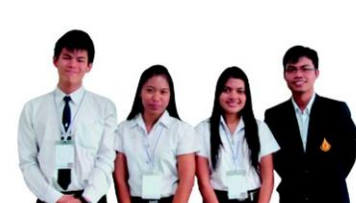
"ดีซองฮ้างเอ็น เลิกคตหมายชื่อชุมชน" มหาวิทยาลัยแม่ฟ้าหลวง