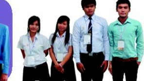
"สืบสานตำนานหุ่นกระบอก สู่อัตลักษณ์แห่งมรดกอีสาน" มหาวิทยาลัยราชภัฏกาฬสินธุ์