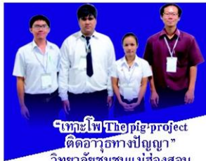
"เดอะไฟ Theopig project คิดอาวุธทางปัญญา" วิทยาลัยชุมชนแม่ฮ่องสอน