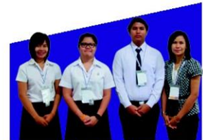
"Library bogie bogie... ขบวนปุ่น ปุ่น เรียนรู้บรรณกิจ" มหาวิทยาลัยเทคโนโลยีราชมงคล อีสาน นครราชสีมา