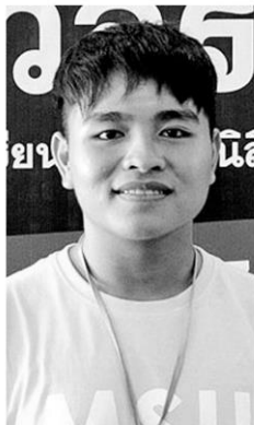
สน กานโสพะพาน