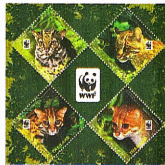
▲ เปิดตัวแสตมบี้สัตว์ป่า ชุด 7

■ 26 ก.ย. เปิดตัวแสตมบี้สัตว์ป่า ชุด 7 บริษัทไปรษณีย์ไทยฯ องค์การสวนสัตว์ในพระบรมราชูปถัมภ์ และ กองทุนสัตว์ป่าโลก (WWF) แถลงข่าวการจัดทำ 'แสตมบี้สัตว์ป่า ชุด 7' รวมฉลองครบรอบ 50 ปีการก่อตั้งกองทุนสัตว์ป่าโลก World Wildlife Fund (WWF) นำรูปสัตว์ตระกูลเสือที่หายากและใกล้สูญพันธุ์ในไทย เช่น แมวป่าหัวแบน แมวดาว แมวลายหินอ่อน เสือไฟ จัดวางในลักษณะสี่เหลี่ยมข้าวหลามตัด ประกอบตราสัญลักษณ์รูปหมีแพนด้าของ WWF