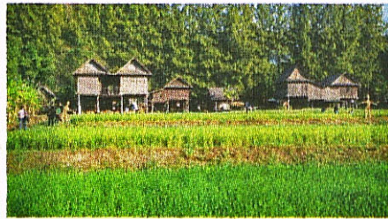
▲ สถาปัตยกรรมพื้นบ้าน อีสานพื้นถิ่น

หมู่บ้านอีสาน จิม ทอมป์สัน ฟาร์ม พร้อมชม 'หมู่บ้านอีสาน' และการก่อสร้าง