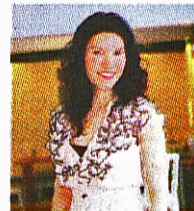
▲ สุนทรีย์ภาพ บุนโยทยาน

■ รับกระแสคนรักสุขภาพ มร. แพทริค วี ทุ่ม 150 ล้านปรับโฉม 'ทรู ฟิตเนส เซ็นทรัลเวิลด์' ให้เป็นศูนย์รวมการบริการด้านสุขภาพและความสวยงามครบวงจร อดใจรอชมปลายปีนี้ ♀