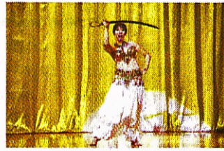
▲ เต้นรอบโลกในวันเดียว 2554