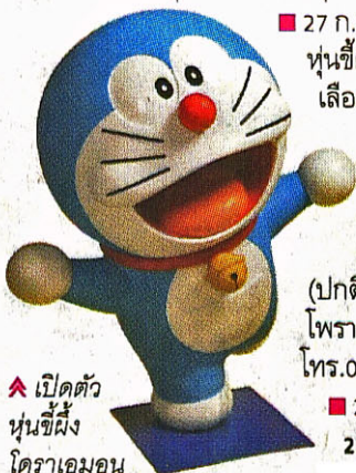
▲ เปิดตัวหุ่นขี้ผึ้งโดราเอมอน

ณ สถานแสดงนำพุซัง สวนสัตว์ดุสิต กรุงเทพฯ 13.00-14.30 น.