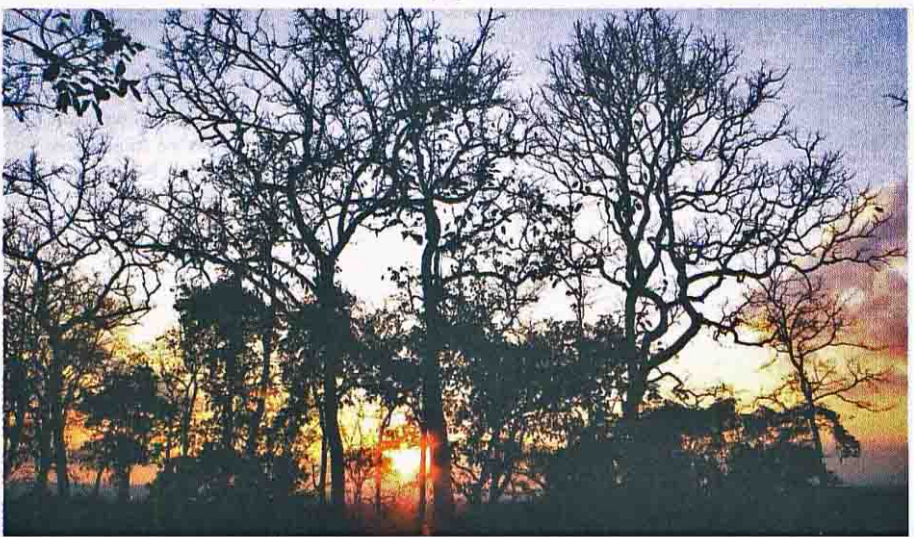
ร่มเงาภูพานสร้างแรงบันดาลใจ