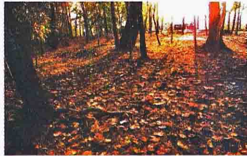
ฤดูไม้ผลัดใบบนผืนป่าภูพาน

โดยมีคำขวัญประจำค่ายว่า "การเดินทางหาความฝัน ฤกษ์วันสิ้นสุด" ภายใต้ปรัชญา...ประสบการณ์ และจินตนาการ คือต้นธารของงานเขียน... ซึ่งผมปรารถนาจะเติมไปอีกคำหนึ่งว่า...และชีวิต