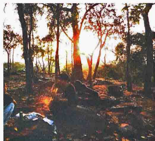
ประสบการณ์และจินตนาการ คือต้นธารของชีวิต