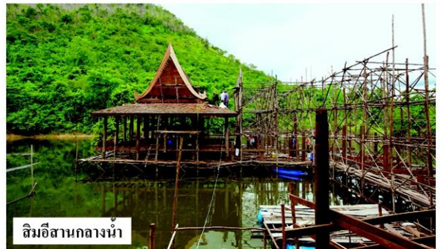
ลิมอีสานกลางน้ำ