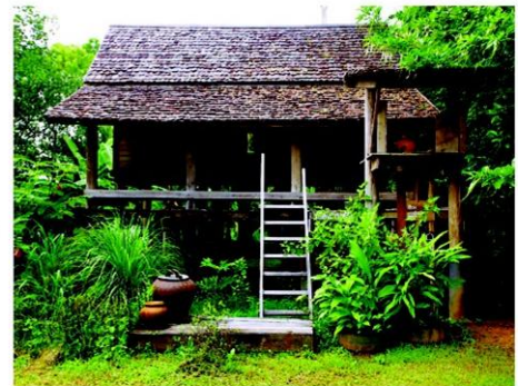
เรือนนางอ้อยใจ

อาทิ "ความสัมพันธ์ทางสังคม" ครอบครัวยุติธรรมและครอบครัวรวม จะสร้างที่อยู่อาศัยตอบสนองความต้องการแตกต่างกัน "ความสัมพันธ์ทางความเชื่อ" การสร้างเรือนมีข้อห้ามต่างๆ ตั้งแต่การเลือกไม้จนถึงโครงสร้างหลักของเรือน ความเชื่อในการหาฤกษ์ยามซึ่งต้องกำหนดเดือนและวันที่เหมาะสม