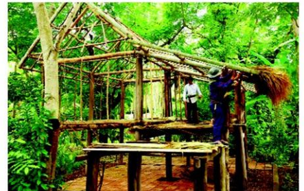
เอือนเครื่องผูก

“เอือนนางผะ” อายุเก่าแก่กว่า 200 ปี “เอือนนางเอ้อย” โคดเค้นด้วยเสวียน หรือแกะ ซึ่งเป็นช่างทำจากไม้ไผ่สาน “เอือนนางแดงอ่อน” มีจุดเค้น คือฝาปรือที่ลงสภาพสมบูรณ์มากที่สุด