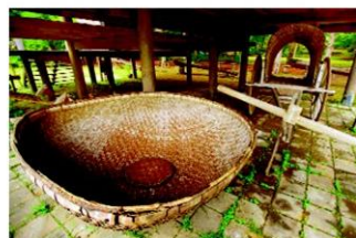
เครื่องใช้ต่างๆ ภายในเรือน