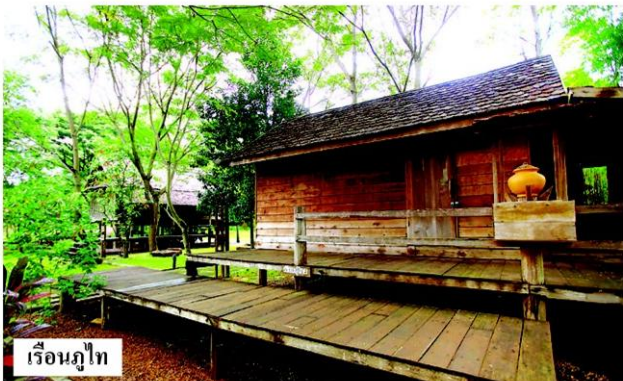
เรือนภูไท

แม้กระทั่งการหาพื้นที่ปลูกเรือน ก็ต้องหลีกเลี่ยงการปลูกคร่อมโพน คร่อมน้ำ คร่อมตุก หรือคร่อมทางผีเทียว ซึ่งชาวอีสานเชื่อว่าจะนำสิ่งอัปมงคลมาให้ รวมถึง “ความเชื่อในการอยู่อาศัย” เช่น ห้องเปิง (ห้องพระ) จะห้ามลูกเขย หรือลูกสะใภ้ขึ้นไปเด็ดขาด และห้ามตีลูกหลานหน้าห้องเปิง ความเชื่อเหล่านี้มีไว้เพื่อควบคุมพฤติกรรมของคนที่อยู่ร่วมกัน ให้รู้จักสิ่งควรไม่ควร จะมีผลต่อการทำมาหากินของครอบครัว และแสดงออกถึงความขำเกรงต่อกัน เป็นต้น