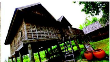
เรือนนางแดงอ่อน