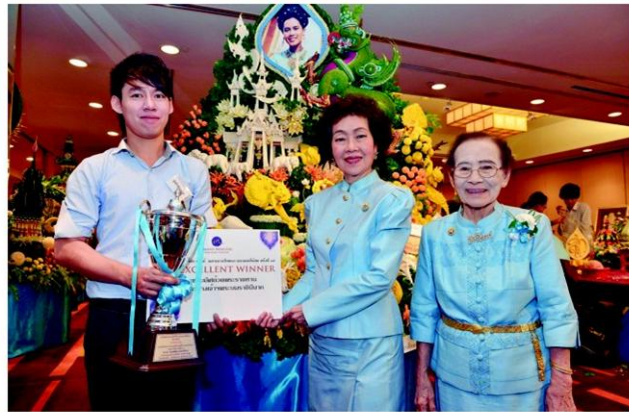
อารยา และอ.เพ็ญพรรณมอบรางวัลด้วยพระราชทาน