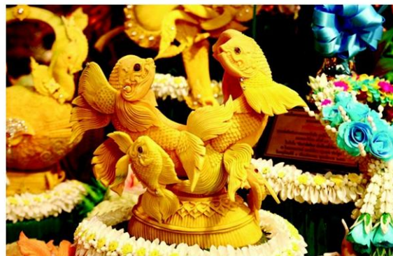
งานแกะสลักจากฟักทอง

2.กลุ่มนักศึกษาและเยาวชน ชนะเลิศ มหาวิทยาลัยเทคโนโลยีราชมงคลกรุงเทพ รองชนะเลิศอันดับ 1 วิทยาลัยอาชีวศึกษานครปฐม รองชนะเลิศอันดับ 2 มหาวิทยาลัยมหาสารคาม ชมเชยอันดับ 1 มหาวิทยาลัยขอนแก่น ชมเชยอันดับ 2 มหาวิทยาลัยราชภัฏเชียงใหม่ เสริมสร้างกำลังใจ ได้แก่ มหาวิทยาลัย