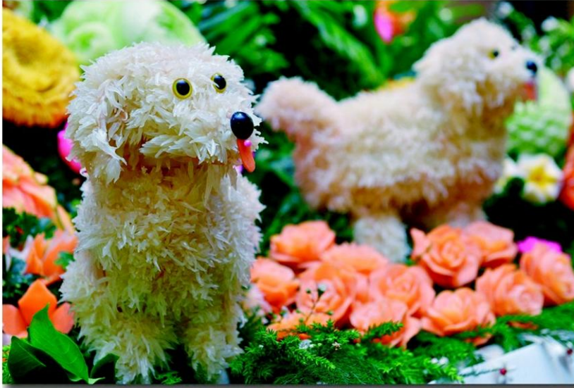
ผลงานน่ารักจากส้มโอ