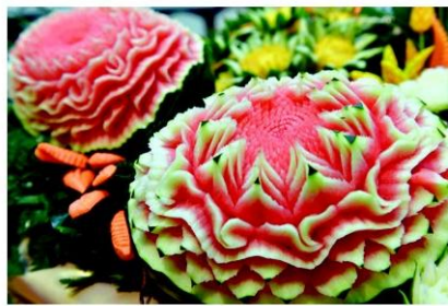
งามวิจิตร

ทรงเป็นศูนย์กลางจับเกล็ดอ่อนและผลัดคันผล งานต่างๆ ให้เป็นที่ยอมรับ