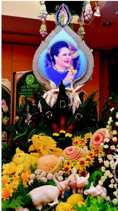
ผลงานจากทีมโนโวเทล สุวรรณภูมิ

หัวข้อข่าว: งานแกะสลักวิถีตรรอด'ศิลปาชีพไทย'