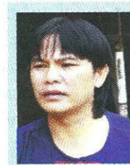
ทัศนาวดี

● ● อาเซียนมาแล้ว...สำนักพิมพ์อมรินทร์ที่จัดเปิดตัวหนังสือ "ความสำเร็จไม่มีข้อยกเว้น" และ "อาเซียนรู้ไว้ได้เปรียบแน่" งานเขียนของ