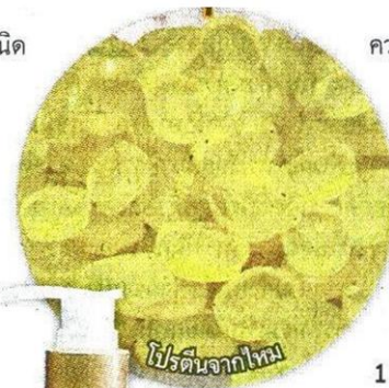
โปรตีนจากไหม

โดยโปรตีนทั้ง 2 ชนิดนี้ จิรภา บอกว่า มีคุณสมบัติใกล้เคียงกับกรดอะมิโนของผิวและผม จึงถือว่าเป็นคุณสมบัติชั้นเลิศในการเป็นมอยเจอร์ไรเซอร์ เพราะสามารถสร้าง