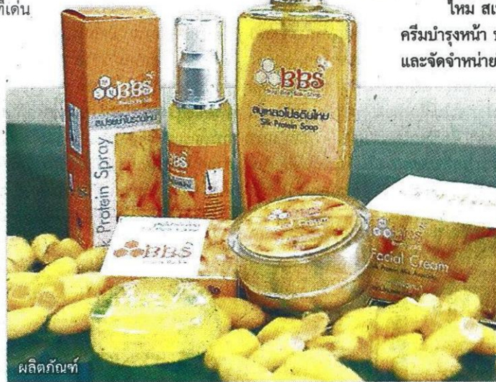
ผลิตภัณฑ์

ซึ่งได้รับความนิยมสนใจจากลูกค้าทั้งชาวไทยและชาวต่างประเทศ ปัจจุบันนำสินค้าออกสู่ตลาดต่างประเทศบ้างแล้ว อาทิ เยอรมนี จีน ซึ่งทั้งหมดนี้ได้รับอนุสิทธิบัตรจากกรมทรัพย์สินทางปัญญา กระทรวงพาณิชย์ เมื่อปี 2552 เรียบร้อย" หัวหน้าโครงการแจ้ง