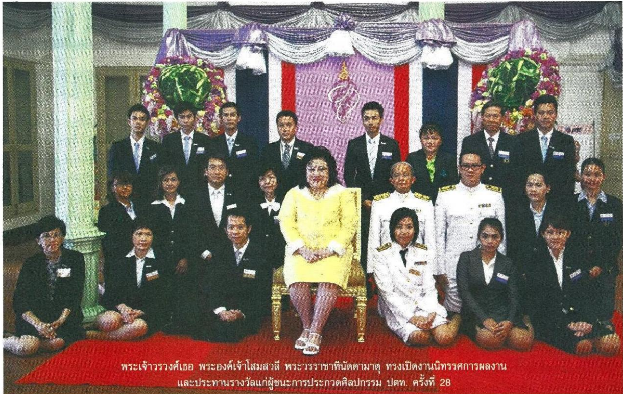
พระเจ้าวรวงศ์เธอ พระองค์เจ้าโสมสวลี พระวรราชทินนิตดา มาตุ ทรงเปิดงานนิทรรศการผลงาน และประทานรางวัลแก่ผู้ชนะการประกวดศิลปกรรม ปตท. ครั้งที่ 28

โฆษณาแฝง: "พลังแห่งธรรมชาติ" ศิลปกรรมรักษ์สิ่งแวดล้อม