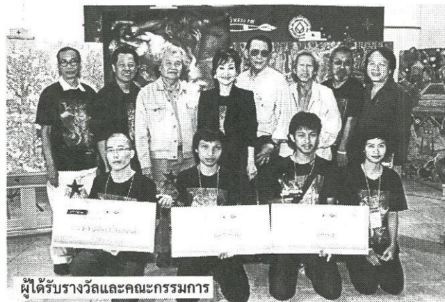
ผู้ได้รับรางวัลและคณะกรรมการ