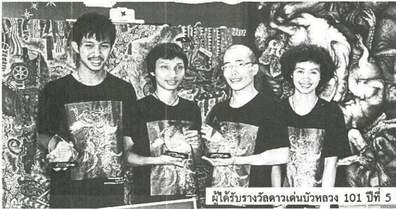
ผู้ได้รับรางวัลดาวเด่นบัวหลวง 101 ปีที่ 5

หัวข้อข่าว: ดาวเด่นบัวหลวง 101 เวทีปั้นศิลปินรุ่นใหม่