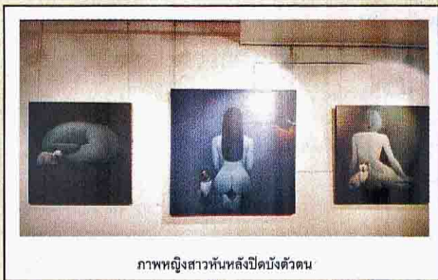
ภาพหญิงสาวหันหลังปิดบังตัวตน

“การวาดรูปแบบนี้ คล้ายกับบทเพลงแจ๊สที่มีเสียงดนตรีต่างกันแต่ก็สามารถบรรเลงให้เกิดความไพเราะได้ ผลงานทั้งหมดก็เช่นเดียวกัน ไม่สามารถกำหนดได้ว่าต้องเป็นสีใดหากแต่มาอยู่ด้วยกันแล้วเกิดความสวยงาม และในความรู้สึกนั้นบางคนอาจมองว่าแสงสีในเมืองมีแต่แสงลบไม่สร้างสรรค์ แต่สำหรับศิลปินแล้วสีสันของเมือง