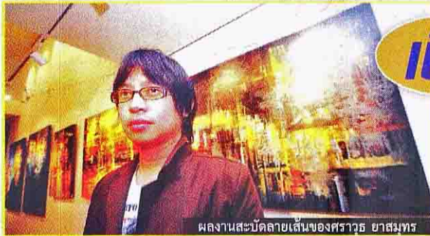
ผลงานสะบัดลายเส้นของศราวรุ ยาสุมทร