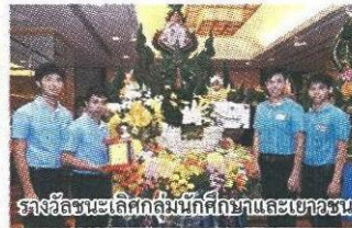
รางวัลชนะเลิศกลุ่มนักศึกษาและเยาวชน

ชนะเลิศ ม.เทคโนโลยีราชมงคลกรุงเทพ รองชนะเลิศอันดับ 1 วิทยาลัยอาชีวศึกษา นครปฐม รองชนะเลิศอันดับ 2 ม.มหาสารคาม