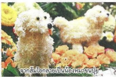
จากส้มโกลายเป็นน้องหมาขนน้อย

ทีม ม.เทคโนโลยีราชมงคลกรุงเทพ เผยว่า งานแกะสลัก ขึ้นอยู่กับความรัก ความชอบ ถ้ามีความสุขที่ได้ทำ ผลงานก็จะออกมาดี เพราะต้องใช้สมาธิและความอดทน หูตาต้องละเอียด ส่วนตลาดต่างๆ ขึ้นอยู่กับความคิดสร้างสรรค์ โดยผลงานชิ้นนี้ได้แรงบันดาลใจจากพระราชดำรัส