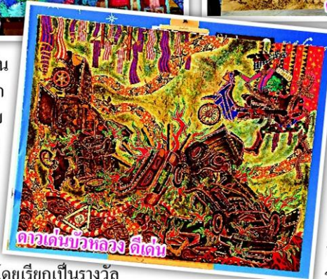
ดาวเด่นบัวหลวง ดีเด่น

ต้องใช้สีก็สามารถถ่ายทอดถึงความรู้สึกผลงานของเขาได้ และปีนี้ผลงานเป็นที่น่าสนใจพอใจมากจนต้องมีรางวัลเพิ่มขึ้นเป็น 4 รางวัล โดยเรียกเป็นรางวัลพิเศษเพราะเวลาตัดสินต้องเลือก 3 ผลงานที่ดีที่สุดที่จะได้รางวัล แล้วนำ 3 ผลงานไปตัดสิน