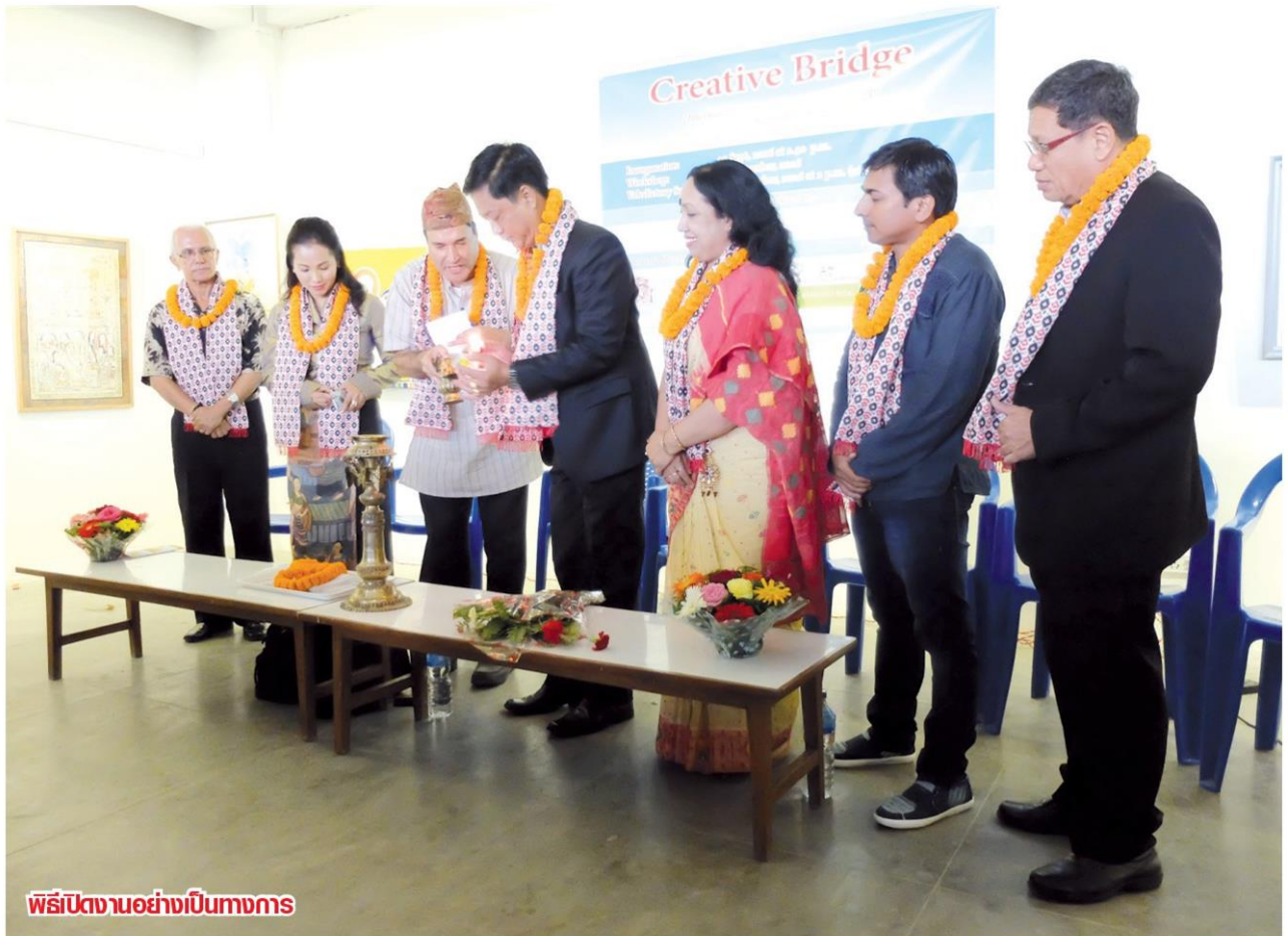
พิธีเปิดงานอย่างเป็นทางการ

คอลัมน์: ท่องเที่ยวรอยเท้าร่ายทาง: 'Creative Bridge' เชื่อมมิตรภาพผ่านงานศิลปะ