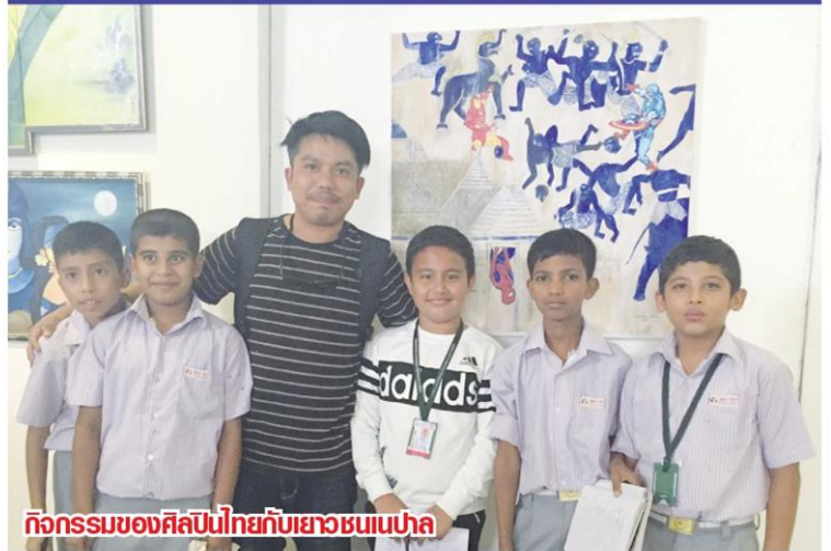
กิจกรรมของศิลปินไทยกับเยาวชนเนปาล

บรรยากาศของงานจึงอบอวลไปด้วย “มิตรภาพ” ความอบอุ่น รอยยิ้ม และเสียงหัวเราะ ปรากฏให้เห็นและได้ยินอย่างต่อเนื่อง สร้างความประทับใจต่อผู้เข้าร่วมงานในครั้งนี้อย่างมาก