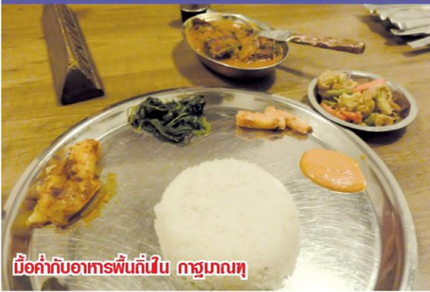
เมื่อค่ำกับอาหารพื้นถิ่นใน กาฐมาณฑุ