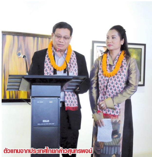
ตัวแทนจากประเทศไทยกล่าวสุนทรพจน์

คอลัมน์: ท่องเที่ยวรอยเท้าร่ายทาง: 'Creative Bridge' เชื่อมมิตรภาพผ่านงานศิลปะ