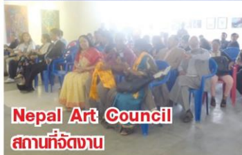
Nepal Art Council สถานที่จัดงาน