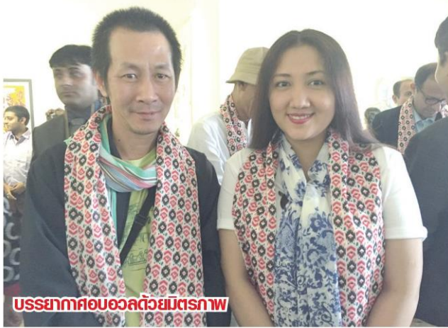
บรรยากาศของลวดลายมิตรภาพ